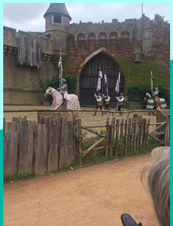
PENDANT UN TOURNOI DE CHEVALIERS