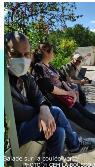
Balade sur la coulée verte