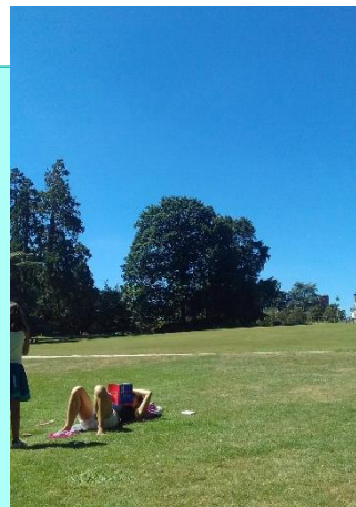
PARC THABOR A RENNES

Quels sont ces moments où l'on revient à soi : les préoccupations, les devoirs mis au placard un instant ?