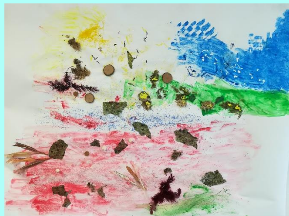
ŒUVRE COLLECTIVE DU GEM LE CANAL