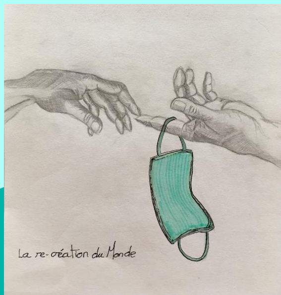
DESSIN DE GUILLAUME DU GEM SUR SEINE