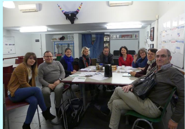
RÉUNION DU COMITÉ DE RÉDACTION